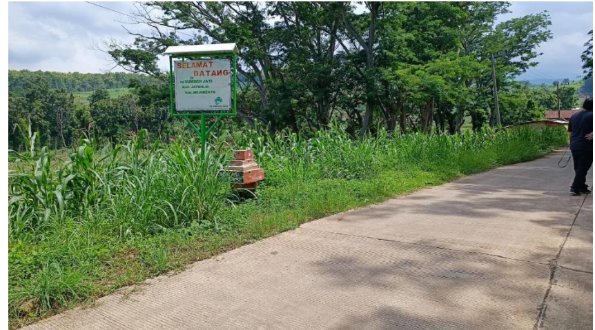
Tugu, Rencana Gapura Desa Sumberjati