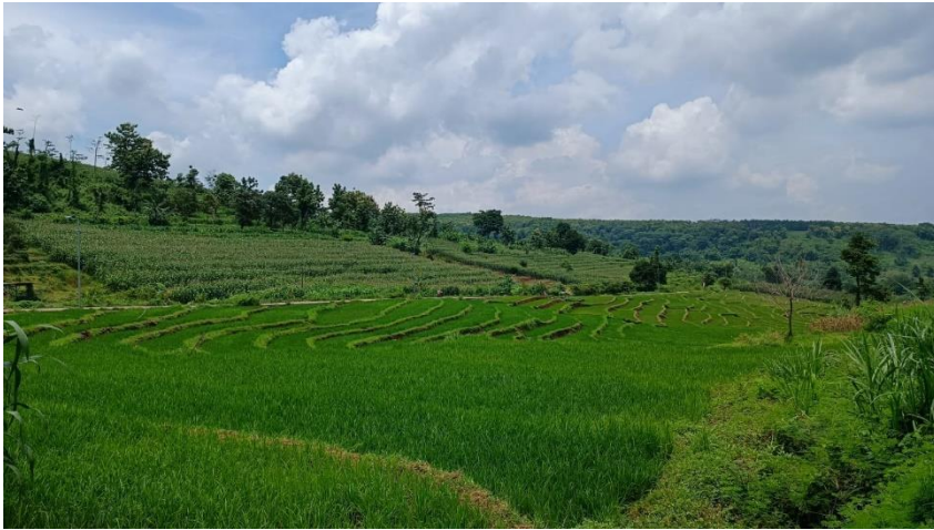
Pemandangan Alam Desa Sumberjati