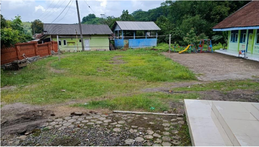
Lap. Volley, Ged. TK, Halaman Balai Desa