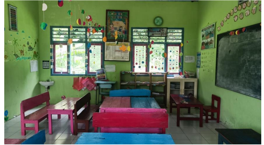
Ruang Kelas TK, Desa Sumberjati