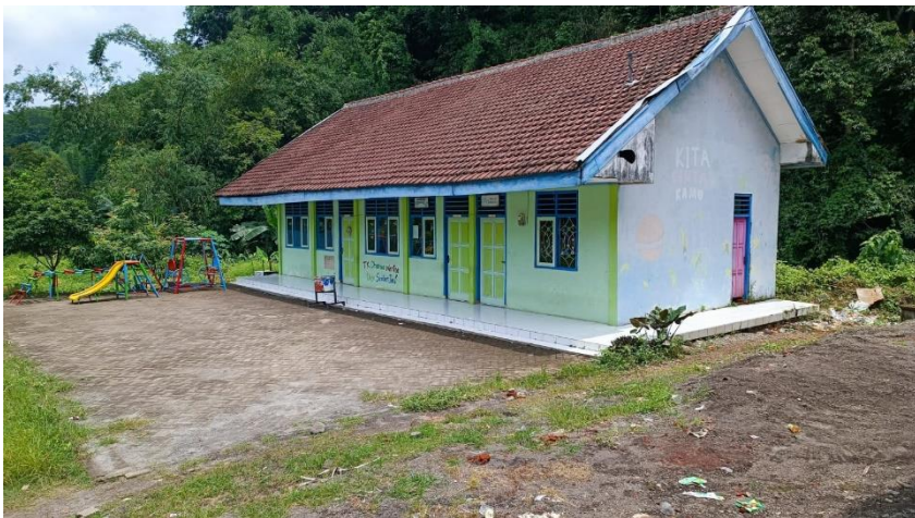
Gedung TK, Desa Sumberjati