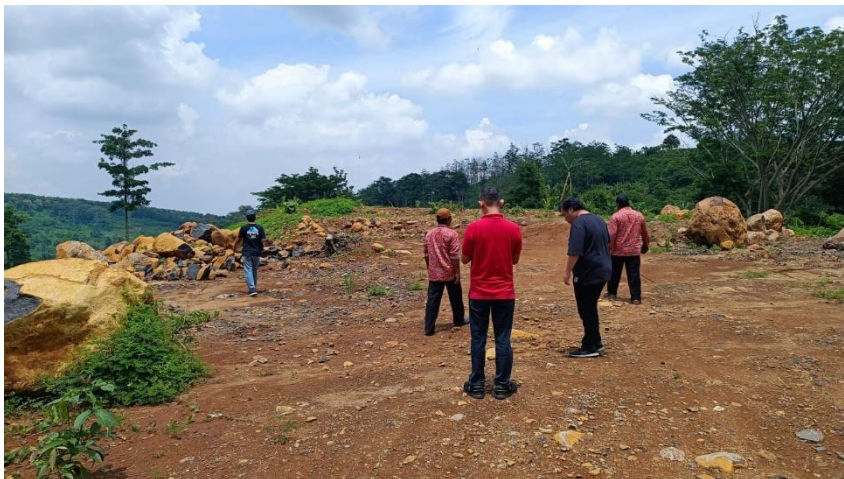
Lokasi Rencana Wisata Desa Sumberjati