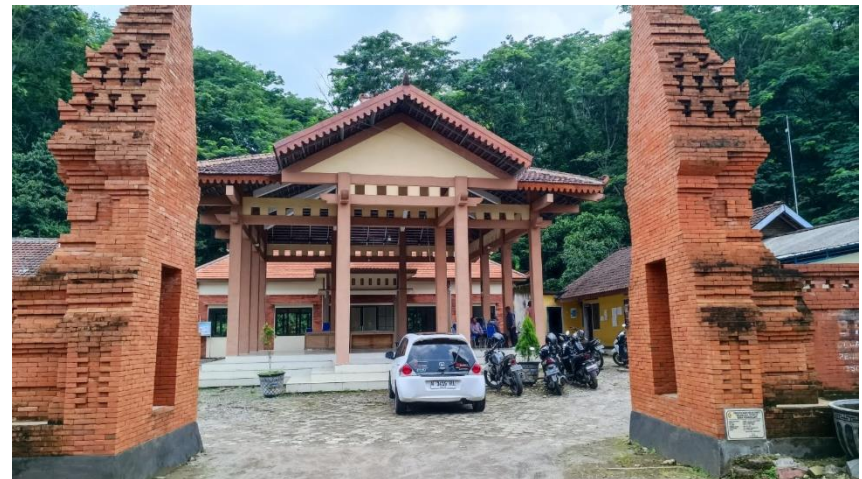
Pendopo Desa Sumberjati